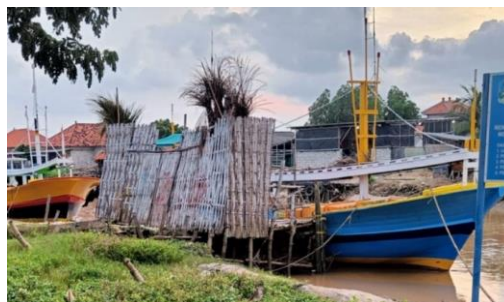
Gambar 1 Kondisi Dermaga di Kabupaten Sampang

Kegiatan dilaksanakan pada bulan September 2023, sasaran Kegiatan pemberdayaan masyarakat ini yaitu Masyarakat nelayan di desa aeng sareh, kegiatan diawali dengan sosialisasi tentang program pemberdayaan dan diskusi Kondisi dermaga yang digunakan untuk bersandarnya kapal/perahu nelayan yang masih terbuat dari bambu yang dibentuk menyerupai jembatan seperti pada gambar dibawah.