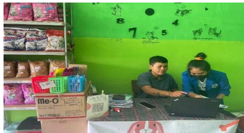
Gambar 2. Dokumentasi pada pertemuan ke 2 di Bisopo Candi

Berikut adalah dokumentasi pertemuan kedua pada ke 2 UMKM ini: