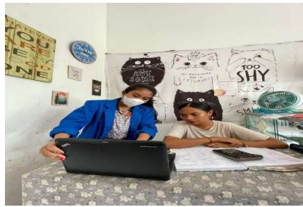
Gambar 3. Kunjungan pada pertemuan ke 2 di Bisopo Kalasan

Pertemuan yang ketiga dilakukan pada tanggal 21 Oktober 2023 pada Bisopo Candi yang dimulai jam 14.00 dan berakhir jam 15.00 dan tanggal 22 Oktober 2023 pada Bisopo Kalasan yang dimulai jam 15.00 -16.00. Proses kali ini kunjungannya lebih singkat karena penulis hanya datang untuk melakukan pengecekan dalam mengerjakan laporan keuangan mereka dan melihat perkembangan dalam pembuatan laporan keuangannya.