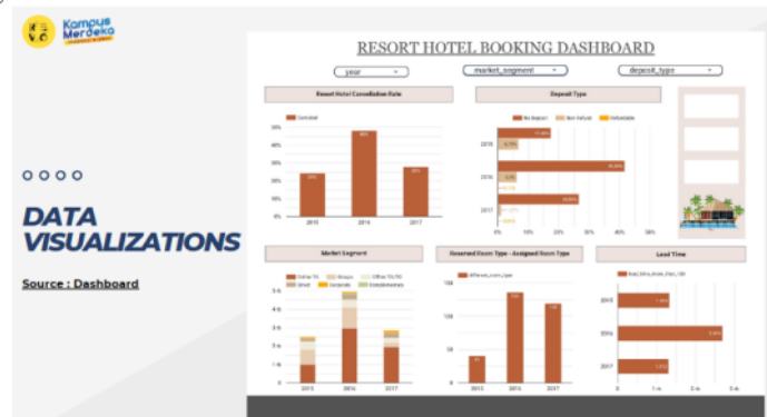
Gambar 2. Capstone Project Data Analytics.

Tahap berikutnya data cleaning , yaitu pembersihan data yang tidak perlu digunakan untuk mempersiapkan data sebelum di analisis dengan beberapa metode. Metode analisis yang umum digunakan di industri, seperti SQL dan Python diajarkan oleh instruktur dari cara yang paling dasar. Setelah data cleaning , tahap selanjutnya data visualization yang sangat penting. Karena sebagai data analyst , hal yang harus dikuasai adalah bagaimana memberikan hasil dari pengerjaan group dalam bentuk visual dan dikomunikasikan dengan baik sehingga pendengar dapat langsung paham dan mengerti.