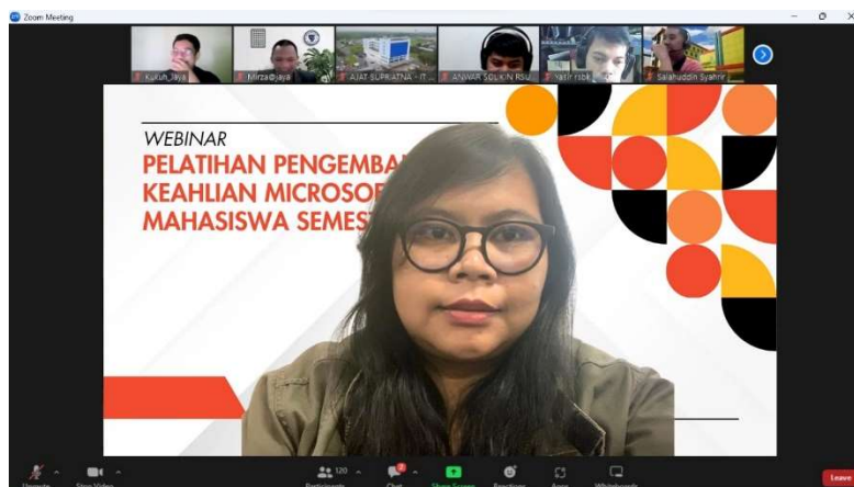
Gambar 2. Diskusi dipandu Oleh Moderator

berkelanjutan terhadap perkembangan keterampilan mahasiswa semester akhir.