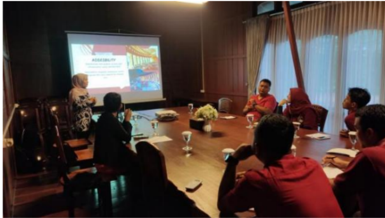
Gambar 4. Materi Desain Interior

Puncak dari program layanan ini menandai perubahan paradigma dalam kemampuan dan keterampilan karyawan, yang berpuncak pada peningkatan nyata di berbagai aspek operasional resor. Anggota staf menunjukkan peningkatan kemahiran dalam promosi media sosial, praktik manajemen, dan prinsip desain interior, serta menerjemahkan pengetahuan teoretis menjadi hasil nyata. Resor ini menyaksikan peningkatan keterlibatan online, peningkatan kepuasan tamu, dan revitalisasi daya tarik estetika, yang menunjukkan dampak transformatif dari inisiatif peningkatan kapasitas. Semangat kerja karyawan melonjak seiring dengan rasa pemberdayaan dan pencapaian yang meresap ke dalam angkatan kerja, mendorong komitmen kolektif terhadap keunggulan layanan dan perbaikan berkelanjutan. Upaya kolaborasi Yusuf Wahyu Setiya Putra, Cisilia Sundari, dan Mira Fitriana, dipadukan dengan dedikasi dan antusiasme karyawan resor, telah mengantarkan era baru inovasi, efisiensi, dan keunggulan di Kasuari Resort Magelang. Melalui inisiatif pembelajaran dan pengembangan yang berkelanjutan, resor ini tetap siap untuk melampaui ekspektasi dan mendefinisikan kembali standar perhotelan, serta menetapkan tolok ukur keunggulan dalam industri ini.