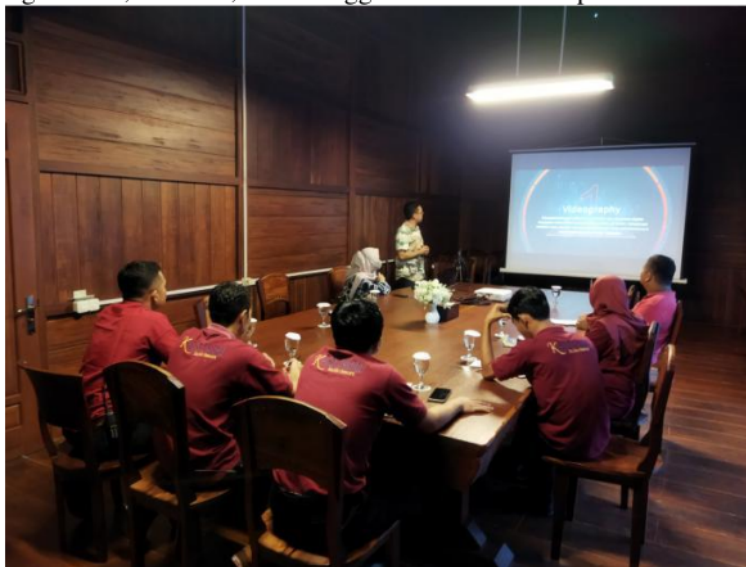
Gambar 2. Materi Promosi Sosial Media