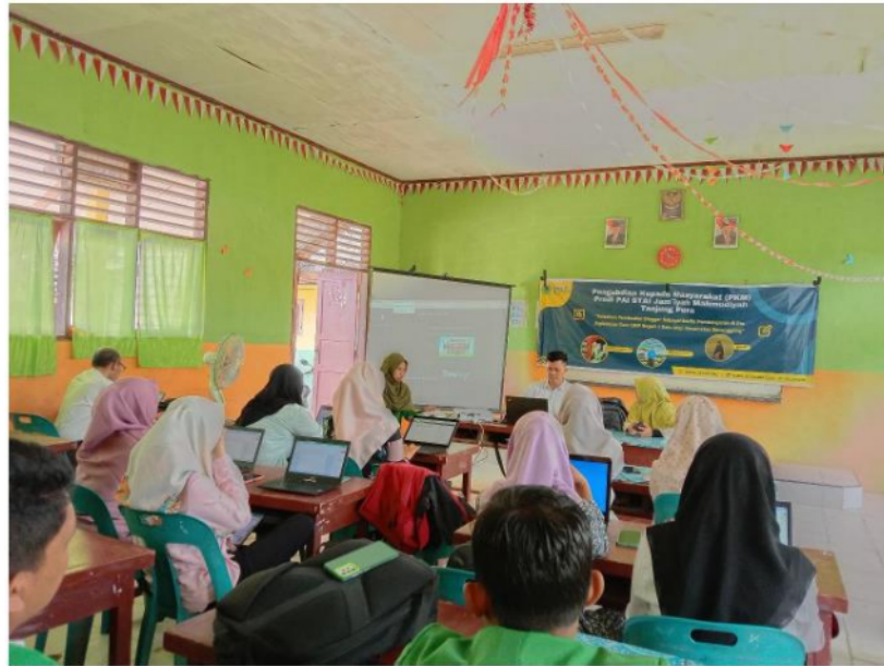
Gambar 2. Keterampilan Teknologi bagi Guru dengan menjadi blogger sebagai media Pembelajaran di Era Digitalisasi

teknologi yang lebih baik. Mereka tidak hanya akan memahami cara menggunakan platform blogger, tetapi juga akan terbiasa dengan konsep-konsep dasar dalam teknologi informasi dan komunikasi (TIK). Ini mungkin termasuk pengetahuan tentang desain web, pengelolaan konten, pengoptimalan pencarian, dan keamanan online. Dengan meningkatnya keterampilan ini, guru-guru akan lebih siap untuk menghadapi tantangan dan peluang yang ditawarkan oleh era digitalisasi dalam konteks pendidikan.