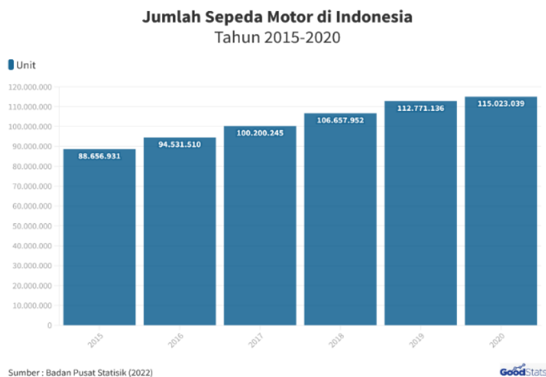
Gambar 1. Jumlah sepeda motor di Indonesia 2015 – 2020 [2]

Jumlah kendaraan bermotor di Indonesia mengalami kenaikan cukup signifikan. Dilihat dari data Badan Pusat Statistik (BPS) tahun 2019 kendaraan di Indonesia berjumlah 133.617.012 unit, mengalami penambahan kendaraan sebanyak 7.108.236 unit atau meningkat 5,3% dibandingkan dengan tahun sebelumnya sebanyak 126.508.776 unit [2].