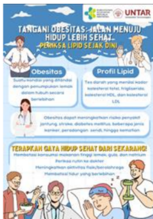
Gambar 2. Poster edukasi parameter kepada lansia