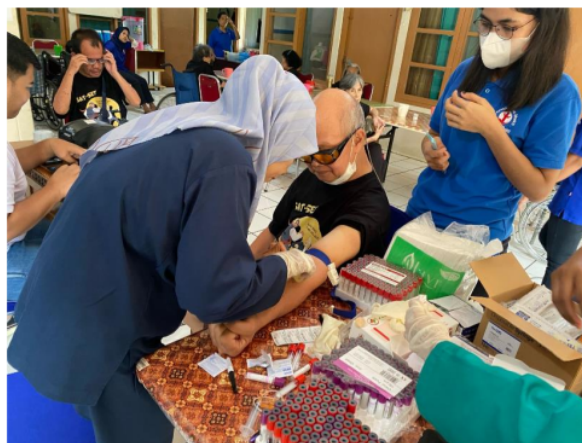
Gambar 3. Kegiatan PKM meliputi anamnesis, pemeriksaan fisik, dan penunjang