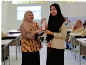
Gambar 3. Pemberian Hadiah untuk Siswa yang Aktif Berdiskusi

Materi ketiga tentang apa saja yang dilakukan ketika kuliah di kampus dan prospek kerja kampus pertanian. Kegiatan ketika kuliah di kampus ada banyak sekali meliputi teori seperti belajar mengajar, tugas, ujian, seminar, kuliah umum dan praktek pertanian baik di laboratorium maupun ekperimental farm. Prospek kerja lulusan pertanian juga sudah bagus. Menurut Rosa (2023) lulusan pertanian dapat menjadi konsultan pertanian, bekerja di industri pangan, akademisi (guru atau dosen), peneliti, bahkan entrepreneur. Setiap sesi materi diakhiri dengan diskusi.