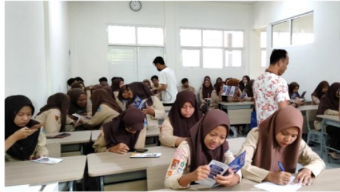
Gambar 1. Pembagian Materi Kepada Siswa-Siswa SMKN 1 Pakis Aji Jepara

Bakti BCA, Karya Salemba Empat (KSE), Beasiswa Bestari, BSI dan sebagainya.