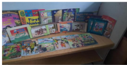
Gambar 3.3 Pojok Baca

Mahasiswa kampus mengajar membuat pojok baca di sudut ruangan kelas untuk memfasilitasi siswa yang ingin membaca. Di sana, tim mahasiswa sudah menyiapkan beberapa buku cerita yang cocok untuk siswa SD. Tim mahasiswa juga menyediakan meja kecil agar siswa nyaman ketika membaca. Pojok membaca ditata dan didesain secara menarik untuk menumbuhkan minat baca siswa. Pojok membaca dibuat di dalam kelas dengan kotak literasi yang dibuat dari bambu untuk meletakkan buku-buku. Pojok membaca tidak hanya berfokus pada buku cerita namun juga terdapat beberapa buku noncerita dan dapat diganti dengan buku yang lain untuk menghindari rasa bosan siswa untuk membaca.