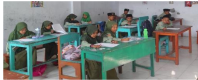
Gambar 3.9 Bimbingan Belajar Literasi