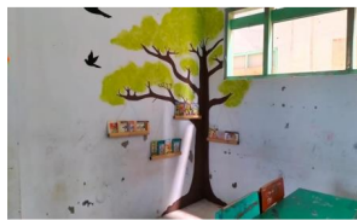
Gambar 3.4 Pohon Literasi

Tim mahasiswa juga membuat pohon literasi di pojok kelas. Untuk bahan bacaan literasi, tim mahasiswa meletakkan buku di bambu yang digantung. Hal ini dimaksudkan agar siswa dapat dengan mudah mengakses buku bacaan. Buku yang diletakkan adalah buku kisah Nabi dan beberapa buku cerita lainnya.