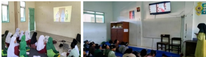
Gambar 3.20 Bioskop Pembelajaran

Bioskop Pembelajaran adalah kegiatan menonton bersama kisah-kisah teladan dan cerita inspirasi. Kegiatan ini sebagai bentuk refleksi diri untuk kembali meneladani baik yang dapat diteladani. Setelah menonton, tim mahasiswa kampus mengajar memberikan beberapa pertanyaan terkait judul, isi cerita, nasehat yang diperoleh, sikap baik yang perlu diteladani. Di bagian akhir, siswa diminta untuk unta membuat rangkuman dari apa yang ditonton.