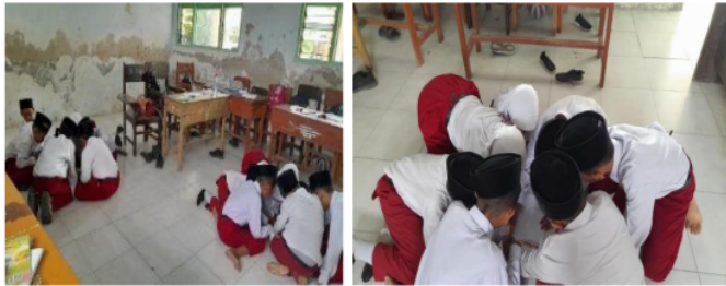
Gambar 3.11 Matematika Asyik