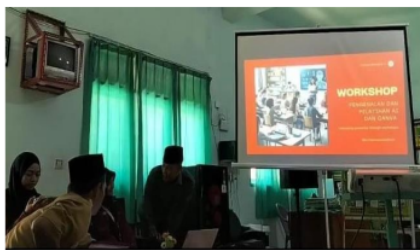
Gambar 3.16 Workshop AI dan Canva bagi Guru