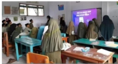
Gambar 3.15 Penggunaan Quizizz untuk Numerasi

Mahasiswa kampus mengajar 7 memberikan soal-soal numerasi kepada siswa menggunakan website “Quiziz”. Soal-soal quiziz juga dimaksudkan untuk melihat pemahaman siswa pada materi matematika yang sudah diberikan sebelumnya. Quiziz ini merupakan aplikasi gamifikasi yang sangat menarik karena dilengkapi dengan musik dan gambar. Setiap pengerjakan soal, secara otomatis jawaban tersebut dapat di cek benar atau salah. Di bagian akhir pengerjaan akan ditampilkan skor total yang diperoleh dan dapat ditentukan siapa yang menjadi juara dalam pengerjaan kuis tersebut yang diperoleh dari siswa yang memperoleh nilai tertinggi dan jawaban tercepat.