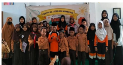
Gambar 3.5 Festival Literasi Numerasi

Untuk memperingati Hari Pendidikan Nasional, mahasiswa melaksanakan kegiatan festival literasi dan numerasi. Dalam festival ini, mahasiswa mengadakan dua lomba di sekolah penugasan, yaitu lomba puisi dan lomba cerdas cermat yang ditujukan untuk kelas 2, 3, 4, dan 5. Pada lomba puisi, mahasiswa meminta 3 orang perwakilan dari per kelas. Sedangkan pada lomba cerdas cermat, mahasiswa meminta 1 tim per kelas dengan setiap tim berisi 3 orang. Kedua lomba berlangsung dengan sangat baik. Dalam kegiatan ini, DPL, kepala sekolah, dan guru pamong ikut membantu dalam pelaksanaannya. DPL juga diminta tim mahasiswa kampus mengajar 7 untuk menjadi juri agar lebih adil dan sportif.