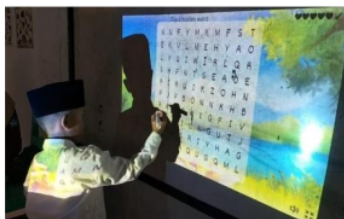
Gambar 3.6 Penggunaan Wordwall untuk Literasi

Wordwall merupakan aplikasi yang bisa digunakan untuk membuat kuis dengan berbagai model kuis, seperti cari kata, menyusun kata, menjawab pertanyaan dengan pilihan ganda, benar salah, dan lain sebagainya. Aplikasi wordwall ini sangat mudah digunakan. Namun, di sekolah penugasan, belum banyak guru yang menggunakan aplikasi ini. Padahal, selain praktis, penggunaan teknologi mampu menarik minat siswa agar lebih antusias dalam belajar. Dalam pelaksanaannya, mahasiswa kampus mengajar menggunakan model cari kata tentang buah, hewan, dan warna. Subjek dari program ini adalah kelas 1. Siswa diminta maju satu per satu untuk mencari kata yang diminta.