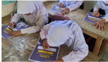
Gambar 3.13 LKPD Perkalian

diri dalam menyelesaikan permasalahan matematika yang melibatkan perkalian. Proses pengerjaan LKPD ini juga dapat membantu guru dalam melakukan evaluasi kemajuan belajar siswa serta menyesuaikan pembelajaran selanjutnya sesuai dengan kebutuhan mereka.