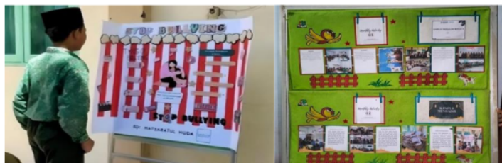
Gambar 3.2 Reaktivasi Mading

Reaktivasi mading merupakan kegiatan pengaktifan kembali mading yang ada di sekolah. Hal ini dilakukan agar mading bisa dimanfaatkan kembali, misalnya sebagai media informasi kepada siswa, menempelkan hasil karya siswa, meletakkan poster, dan lain-lain.