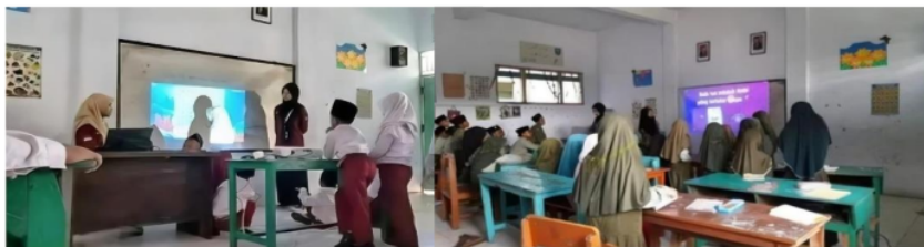
Gambar 3.17 Adaptasi Teknologi dengan Permainan Web Numerasi dan Literasi

Program ini mengenalkan beberapa permainan literasi dan numerasi berbasis web yang bebas akses, serta mengajarkan bagaimana cara memainkannya. Sehingga siswa dapat memanfaatkan teknologi dengan baik. Beberapa permainan web yang digunakan seperti quizizz dan wordwall.