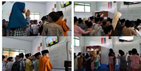
Gambar 3.19 Penggunaan Ice Breaking

Ice breaking merupakan kegiatan yang sering diberikan tim mahasiswa kampus mengajar karena siswa akan sering merasa bosan jika monoton pada 1 kegiatan. Ada beberapa ice breaking yang tim mahasiswa lakukan dalam pembelajaran: Pertama yaitu “tepuk semangat” dan “lagu semangat”. Lagu ini sangat bagus untuk mengembalikan “mood” dan semangat siswa untuk mengikuti serangkaian pembelajaran. Kedua, ice breaking “Kebalikan”. Di ice breaking ini, siswa diminta berdiri, berbaris, dan memegang pundak teman di depannya. Tata cara bermainnya yaitu, ketika tim mahasiswa kampus mengajar mengucapkan “lompat ke kiri”, maka yang harus dilakukan oleh siswa yaitu lompat ke kanan (kebalikan dari kiri). Ice breaking ini sangat efisien untuk menguji konsentrasi siswa. Ketiga, ice breaking bernyanyi bersama.