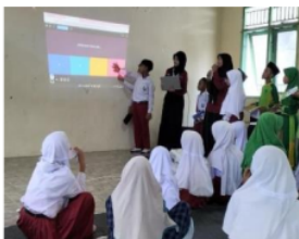
Gambar 3.7 Penggunaan Quizizz untuk Literasi

Mahasiswa kampus mengajar 7 memberikan soal-soal literasi kepada siswa menggunakan website “Quizizz”. Soal-soal quizizz juga dimaksudkan untuk melihat pemahaman siswa pada materi yang sudah diberikan sebelumnya. Quizizz ini merupakan aplikasi gamifikasi yang sangat menarik karena dilengkapi dengan musik dan gambar. Setiap pengerjakan soal, secara otomatis jawaban tersebut dapat di cek benar atau salah. Di bagian akhir pengerjaan akan ditampilkan skor total yang diperoleh dan dapat ditentukan siapa yang menjadi juara.