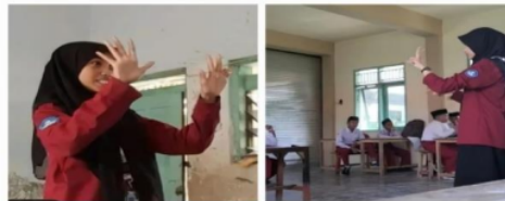
Gambar 3.12 Pengenalan Metode Jarimatika

Pelatihan jarimatika merupakan pelatihan perhitungan perkalian menggunakan jari dan/atau ruas jari yang ditujukan untuk kelas 3, 4, dan 5. Pelatihan ini menggunakan metode ceramah di mana tim mahasiswa menjelaskan kepada siswa di kelas masing-masing. Tujuan dari program ini tidak lain untuk mempermudah siswa dalam menghitung perkalian. Untuk menguji pemahaman mereka, setelah pelatihan mahasiswa memberikan tugas berupa teka-teki silang perkalian.