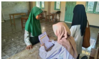
Gambar 3.14 Hafalan Perkalian

Setelah mendapatkan penjelasan tentang metode jarimatika dan menyelesaikan LKPD Perkalian, siswa diminta secara mandiri menghafalkan tabel perkalian. Tujuan utama dari hafalan perkalian ini untuk memperkuat pemahaman siswa terhadap konsep perkalian dan meningkatkan kecepatan serta keakuratan mereka dalam menjawab soal-soal perkalian. Setelah siswa berhasil menghafalkan tabel perkalian, mereka akan diminta untuk menyampaikan hafalannya dan akan diberi tanda sebagai bukti bahwa mereka telah menyelesaikan tugas tersebut. Proses pemberian tanda ini dapat berupa stiker atau tanda lain yang diberikan oleh guru sebagai pengakuan atas pencapaian siswa dalam master hafalan perkalian. Melalui program kerja hafalan perkalian ini, diharapkan siswa dapat meningkatkan keterampilan matematika mereka secara menyeluruh dan siap menghadapi konsep matematika yang lebih kompleks.