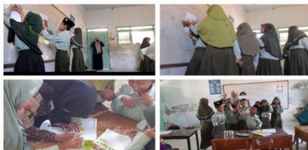
Gambar 3.21 English Day

English Fun merupakan kegiatan pembelajaran bahasa Inggris interaktif yang dikemas dengan game edukasi. Dalam kegiatan ini, mahasiswa kampus mengajar 7 membawa dua topik: Body Parts dan My dream . Di topik body parts , sebelum memulai game, siswa dibagi menjadi 3 kelompok. Setelah itu, siswa diberi selembor kertas berupa materi untuk mereka baca dan ingat. Selanjutnya tim mahasiswa memulai permainan dengan model GTT ( Game Tour Tournament ) dimana setiap anggota kelompok menjawab 3 soal dari soal yang sudah disediakan di papan. Di topik my dreams , siswa dikenalkan dengan kosa kata tentang cita-cita kepada siswa, kemudian siswa diminta untuk menempel fingerprint mereka di pohon yang sudah diprint dan menulis nama dan cita-cita mereka.