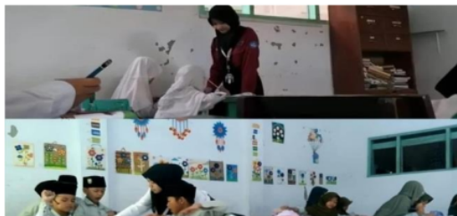
Gambar 3.10 Bimbingan Belajar Numerasi

Setiap hari Senin, Rabu, dan Jum'at, mahasiswa KM 7 jurusan matematika mendampingi bimbel numerasi. Mahasiswa kampus mengajar 7 berkolaborasi dengan guru bimbel matematika dalam melakukan pendampingan dengan mengecek jawaban siswa dibuku paket dan membimbing siswa yang kurang paham dengan materi.