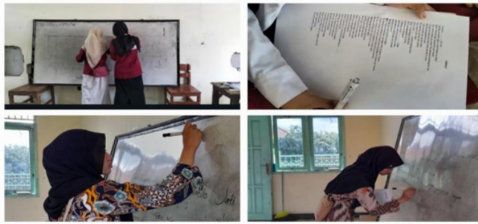
Gambar 3.18 Mengisi Kelas Kosong