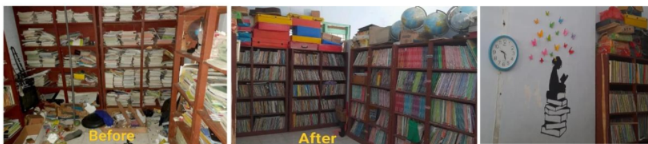
Gambar 3.1 Revitalisasi perpustakaan

perpustakaan dan lebih berminat untuk mengunjungi dan membaca buku di perpustakaan. Dalam kegiatan revitalisasi ini, ada beberapa rincian sub-kegiatan yang sudah dilakukan, di antaranya: (a) merapikan buku dan memilah barang (yang masih bisa dipakai dan yang sudah tidak bisa dipakai). Mahasiswa menempatkan dan menyusun barang-barang yang sekiranya tepat (tidak mengganggu keindahan). Selain itu, mahasiswa juga merapikan buku-buku, menyesuaikan sesuai kelas dan tema masing-masing; (b) Pelabelan Rak Buku untuk mempermudah guru dalam mencari buku karena bukunya sudah ditata ulang, mahasiswa melabeli setiap rak buku dengan nama kelas masing-masing; (c) Menghias Perpustakaan yaitu kegiatan pembuatan mural di perpustakaan dan menempel beberapa motivasi agar siswa lebih semangat dan antusias dalam membaca buku.