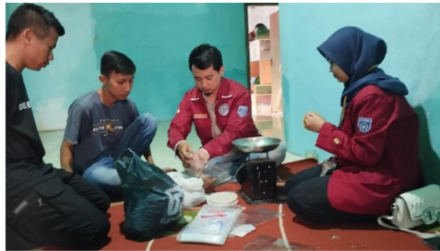
Gambar 3. Pemberian Materi