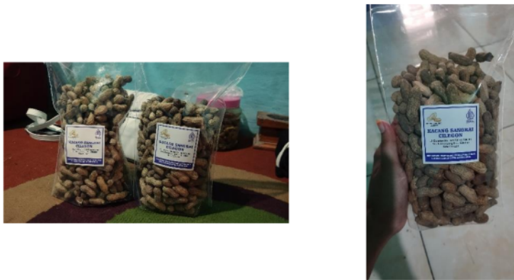
Gambar 6. Hasil Kemasan dan Label