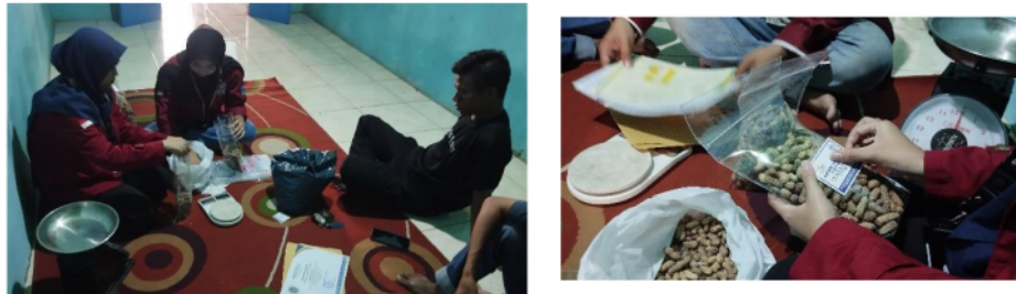
Gambar 4. Tutorial Pembuatan Kemasan dan Label