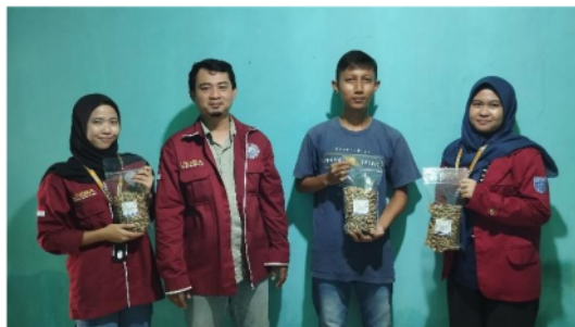
Gambar 5. Sesi Foto Bersama Tim Pelaksana dengan Mitra