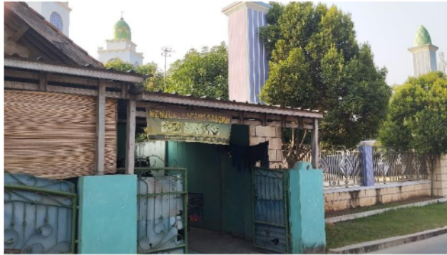
Gambar 1. Lokasi Mitra UMKM Kacang Sangrai Cilegon

berkualitas, harga tidak masalah bagi sebagian pembeli yang sangat mengutamakan kualitas. Fokus penelitian ini adalah: 1) Bagaimana kemasan mempengaruhi produk UMKM Kelurahan Kalitimbang? 2) Bagaimana kemasan memainkan peran dalam meningkatkan pemasaran produk UMKM Kelurahan Kalitimbang di kemasan "Kacang Sangrai Cilegon"?