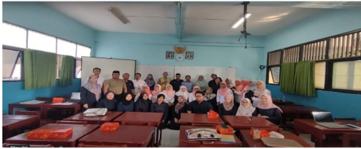
Gambar 3. Kegiatan Penutupan

Berdasarkan hasil kegiatan berupa pelatihan kepada guru dalam membuat instrument pembelajaran berdiferensiasi di SMP Negeri 14 Jakarta diperoleh data sebagai berikut: