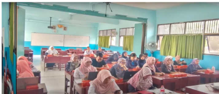
Gambar 2. Praktik Pembuatan Instrumen