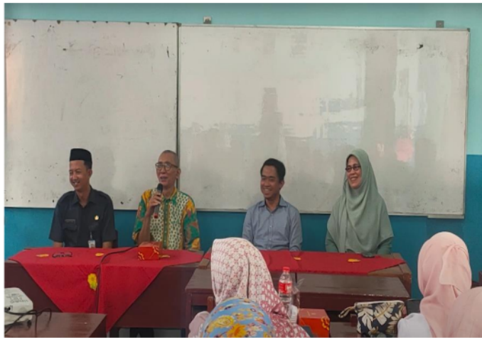
Gambar 1. Pembukaan Kegiatan

Kegiatan pengabdian berupa pelatihan kepada guru dalam membuat instrument pembelajaran berdiferensiasi di SMP 14 diikuti oleh 24 peserta. Adapun kegiatan yang dilakukan secara garis besar terdiri dari 3 tahap, yaitu 1) Penjelasan atau pemaparan materi, 2) praktik membuat instrument pembelajaran berdiferensiasi, 3) Evaluasi.