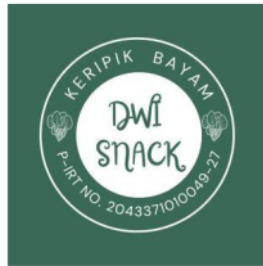
Gambar: 1. Logo Produk Kripik Bayam

masing aplikasi maupun tren yang tengah berjalan. Pemahaman tersebut dapat diperoleh melalui beranda di setiap aplikasi atau media sosial. Sehingga pelaku UMKM diharapkan terus memantau kondisi dan situasi yang terus berubah melalui beranda media sosial. Selanjutnya, pembuatan titik Google Maps merupakan langkah yang strategis untuk mengumpulkan konsumen yang sedang mencari produk tertentu. Dengan menerapkan kata kunci yang relevan seperti “pusat, murah, dan enak” dapat meningkatkan visibilitas sehingga konsumen dapat mudah menemukan tempat yang mereka butuhkan melalui kata kunci tersebut. Adapun untuk pembuatan logo tidak dilakukan secara langsung melainkan di hari selanjutnya dalam waktu 2 hari pengerjaan beserta proses pencetakan dalam bentuk stiker. Dalam pembuatan logo dan label dilakukan pendampingan secara langsung kepada pelaku UMKM dengan media aplikasi editing yaitu Canva. Stiker logo beserta label dalam bentuk soft file , kemudian dicetak dan diberikan kepada setiap UMKM. Berikut adalah salah satu logo dari produk keripik bayam: