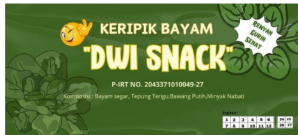
Gambar: 2. Logo Produk Kripik Bayam