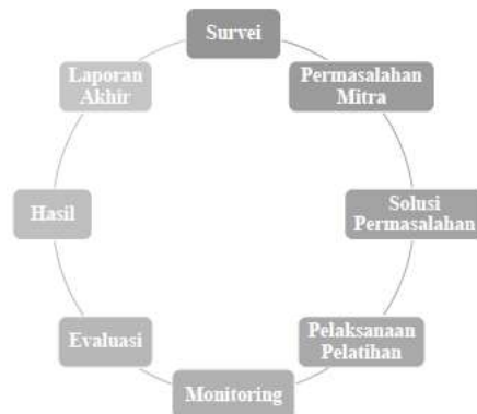
Gambar 3.3 Iptek yang ditransfer ke mitra

Setelah diadakan pengenalan mengenai Aplikasi Canva kepada peserta, secara umum kegiatan pengabdian masyarakat ini dikatakan berhasil. Hal ini di indentifikasikan dengan adanya pemahaman baru para peserta mengenai Aplikasi Canva dapat mereka manfaatkan dalam proses penjualan serta pembelian. Dari segi teknis lapangan saat melakukan pelatihan, target dari kegiatan ini pun dikatakan berhasil.