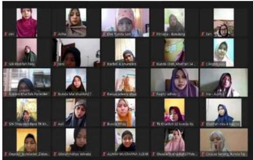
Gambar 3.2 foto pemberian materi via zoom meet

Setelah diadakan pengenalan mengenai Aplikasi Canva kepada peserta, secara umum kegiatan pengabdian masyarakat ini dikatakan berhasil. Hal ini di indentifikasikan dengan adanya pemahaman baru para peserta mengenai Aplikasi Canva dapat mereka manfaatkan dalam proses penjualan serta pembelian. Dari segi teknis lapangan saat melakukan pelatihan, target dari kegiatan ini pun dikatakan berhasil.