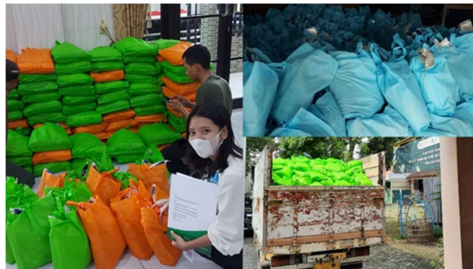
Gambar 3. Proses pendistribusian paket sembako ke kelurahan sekitar perusahaan

Dalam pendistribusian menggunakan pendekatan partisipatif. Pendekatan partisipatif melibatkan secara langsung penulis dengan objek yang disasar. Mahasiswa bertugas memantau truk sembako dan memastikan sembako sampai tujuan dibuktikan dengan penandatanganan oleh kepala desa terkait sebagai bukti secara tertulis bahwa paket sembako telah diterima.