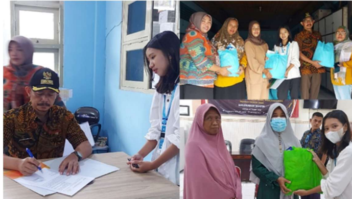
Gambar 4. Penyerahan dan pendataan sembako kepada masyarakat

Dalam pendistribusian sembako dibagikan secara kolektif di balai desa kelurahan masing masing, namun warga mengambjl secara langsung dibalai desanya masing masing. Dilakukan juga wawancara kepada penerima sembako mengenai kesan dan pesan akan adanya bakti sosial ini.