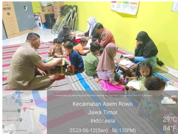
Gambar 4. 2 Kegiatan Pelayanan Bengi di Balai RW 03