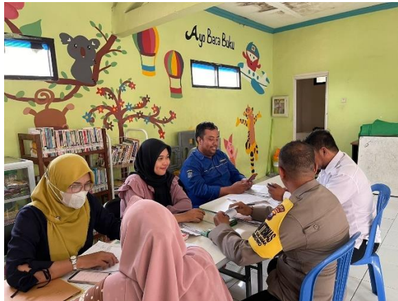
Gambar 4. 1 Kegiatan Pelayanan Adminduk di Balai RW 02