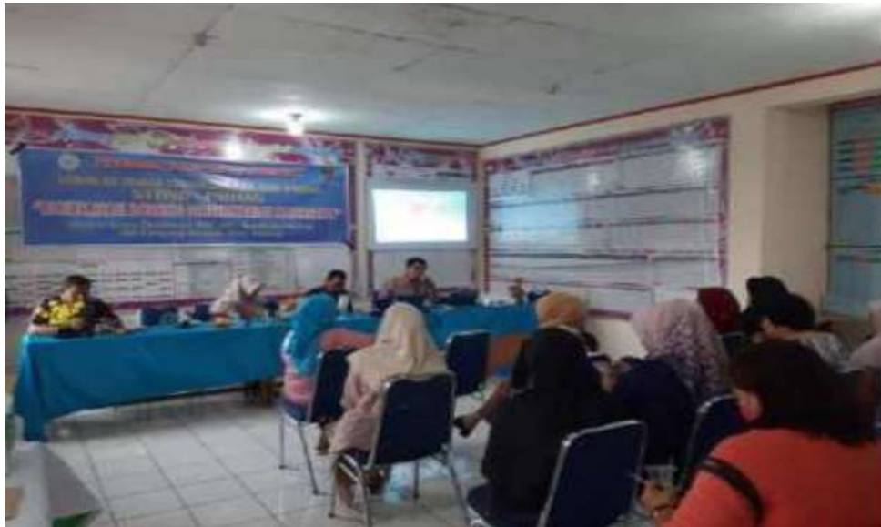
Gambar 3. Pemateri Trend Pemasaran Media Sosial

Mudahnya penyebaran arus informasi dan adanya sistem perdagangan bebas meningkatkan kesadaran konsumen akan banyaknya pilihan produk barang dan jasa yang dapat dipilih. Hal tersebut menyebabkan para pelaku usaha harus membenahi strategi pemasaran agar dapat bersaing di era sistem perdagangan bebas serta dapat meningkatkan penjualan. Salah satu potensi perkembangan teknologi yang dapat dimanfaatkan sebagai media pemasaran adalah media sosial.