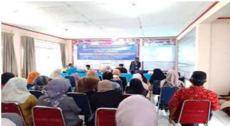
Gambar 2. Pemateri Internet Sehat Bikin Hebat

Di dalam penyampaian materi ini, peserta antusias dengan materi Teknologi Digital untuk Pendidikan anak, dimana Para masyarakat dan remaja sekarang ini sudah tidak asing lagi dengan sosial media, hampir setiap orang pasti memiliki akun sosial media diantaranya Facebook, Twiter, Instagram. tetapi yang menjadi permasalahan saat ini maraknya internet tidak sehat dan aman di sosial media tetapi para masyarakat dan remaja kurang paham bagaimana meliterasi sebuah internet tidak sehat dan aman di sosial media. Dan juga masyarakat tidak tahu tentang internet sehat dan aman untuk anak.