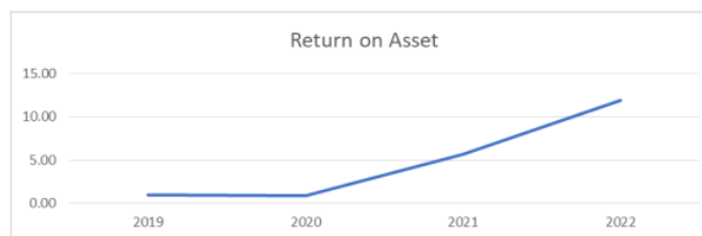
Gambar 3. Rata-rata Return oon Asset Perusahaan Subsektor Logistics and Forwarding

Berdasarkan grafik tersebut diketahui rata-rata hitung Debt to Equity Ratio menghadapi kemerosotan yang dapat dikatakan tinggi pada tahun ke tahun. Pada tahun 2020 terjadi penurunan sebesar 28,06%. Kemudian pada tahun 2021 dan tahun 2022 terjadi penurunan yang signifikan sebesar -3,93% dan -7,39%.