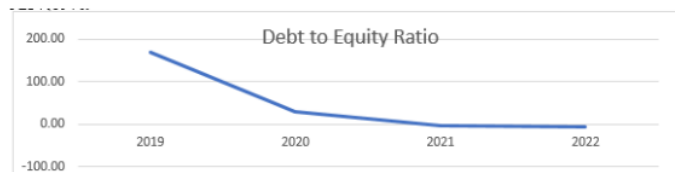
Gambar 2. Rata-rata Debt To Equity Ratio Perusahaan Subsektor Logistics and Forwarding

Berdasarkan grafik tersebut diketahui rata-rata hitung Current Ratio menghadapi ketidakstabilan atau naik-turun pada tahun ke tahun. Periode tahun 2020 nilai rata-rata Current Ratio terjadi kemerosotan yang signifikan yaitu sejumlah 155,80%. Selanjutnya pada tahun 2021 sampai 2022 lambat laun terjadi kenaikan yang cukup signifikan yaitu sebesar 219,50% dan 237,69%.