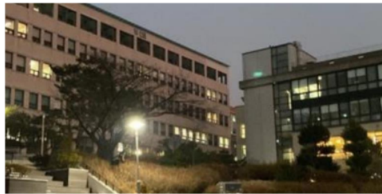
Gambar 2 Gedung Perpustakaan Seoul National University