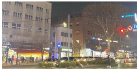
Gambar 3 Kawasan Sekitaran Wilayah Seoul National University