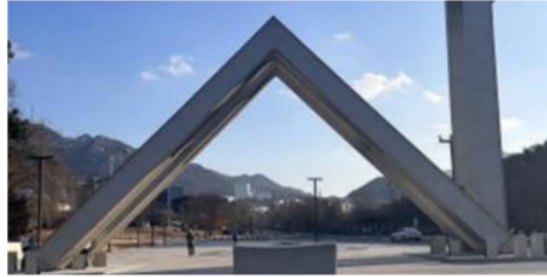
Gambar 1 Gate Utama Seoul National University Gwanak-Gu Office

bulan berikutnya adalah pelaksanaan observasi dan analisis data secara ril selama penulis berada di Korea Selatan, dan dua bulan setelahnya adalah tahap penyusunan hasil laporan penelitian.