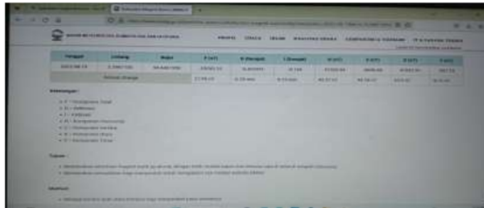
Gambar 3.1 Hasil koreksi IGRF secara online

Peta anomali magnetik global, peta anomali sisa akibat lanjutan ke atas, peta anomali lokal akibat lanjutan ke atas, peta anomali reduksi kutub, dan anomali kontur penampang jalur regional A-A dan B-B. Selanjutnya, kami membuat model penampang abnormal tereduksi untuk menara jalur AA dan model penampang abnormal tereduksi untuk menara jalur B-B, dan melakukan interpretasi kuantitatif.