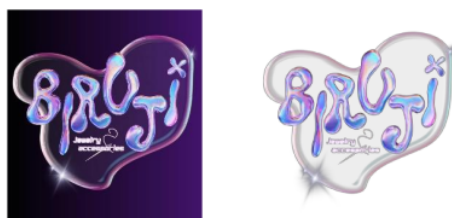
Gambar 3.2. Logo Biruji

Logo Biruji adalah sebuah karya desain yang menggabungkan elemen-elemen yang kuat dan simbolis untuk menciptakan identitas visual yang unik dan memikat. Berikut adalah penjelasan tentang logo Biruji yang mencerminkan konsep futuristik, transparansi, dan keanggunan