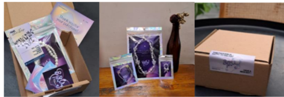
Gambar 3.3. Packaging / Pengemasan