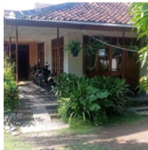
Gambar 1. Rumah Produksi Mahakarya Canting

Rumah produksi Mahakarya Canting didirikan sejak tahun 2002 oleh pasangan suami istri yaitu Ibu Ina dan Pak Sunandar yang berlokasi di Jl. Parapat, Pangandaran, Kec. Pangandaran, Kab. Pangandaran Jawa Barat. Usaha dengan skala UMKM ini bergerak di bidang pengolahan abon berbahan dasar daging ikan dan telah memiliki karyawan sebanyak 2 orang. Pada awalnya, usaha ini berlokasi di Bandung dan memfokuskan produksinya pada abon sapi dan ayam. Kemudian setelah berpindah lokasi produksi ke Pangandaran, karena keberadaan bahan baku ikan yang mudah didapatkan