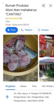
Gambar 6. Pemasaran Abon Ikan melalui Google Maps

Tokopedia merupakan salah satu e-commerce yang tepat untuk mendukung pemasaran produk dari rumah produksi Mahakarya Canting. Dengan memanfaatkan fitur-fitur yang tersedia secara maksimal, pelaku usaha dapat meningkatkan visibilitas produk mereka dan menjangkau lebih banyak konsumen (Pauzi et al. , 2023)