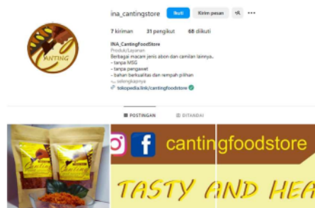
Gambar 7. Pemasaran Abon Ikan melalui Instagram