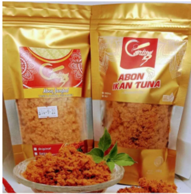
Gambar 3. Kemasan Standing Pouch Sablon

dan informasi nilai gizi. Warna kemasan menggunakan warna cerah yaitu pink . Pemilihan warna pink ini dilakukan untuk menarik perhatian dan minat anak-anak karena abon ikan biasa dikonsumsi oleh anak-anak sebagai pendamping nasi atau camilan. Penggunaan logo canting dengan motif batik juga diterapkan pada kemasan untuk menunjukkan ciri khas budaya Indonesia.