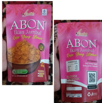
Gambar 4. Kemasan Standing Pouch Full Print

Kemasan memiliki peranan yang sangat krusial selain untuk pelindung isi produk, tetapi juga untuk menarik perhatian atau minat beli konsumen. Saat ini konsumen tidak hanya mempertimbangkan rasa, tetapi juga estetika dan daya tarik visual dari produk yang akan dibeli. Oleh karena itu pengembangan produk melalui kemasan penting dilakukan agar dapat bersaing dengan produk-produk lain di pasaran. Pengelolaan kemasan yang