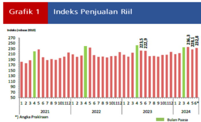
Gambar 1. Grafik Hasil Survei Penjualan Eceran

Melalui Survei Penjual Eceran (SPE) yang dilakukan oleh Bank Indonesia Kinerja penjualan eceran pada Juni 2024 diperkirakan meningkat. Hal ini tecermin dari Indeks Penjualan Riil (IPR) Juni 2024 yang mencapai 232,8 atau secara tahunan tumbuh 4,4% (yoy). Meningkatnya penjualan eceran didorong oleh Kelompok Perlengkapan Rumah Tangga Lainnya, Subkelompok Sandang, serta Kelompok Makanan, Minuman, dan Tembakau. Secara bulanan, penjualan eceran diperkirakan tumbuh 2,1% (mtm), lebih tinggi dibandingkan dengan pertumbuhan bulan sebelumnya yang mengalami kontraksi (bps.go.id, 2024).